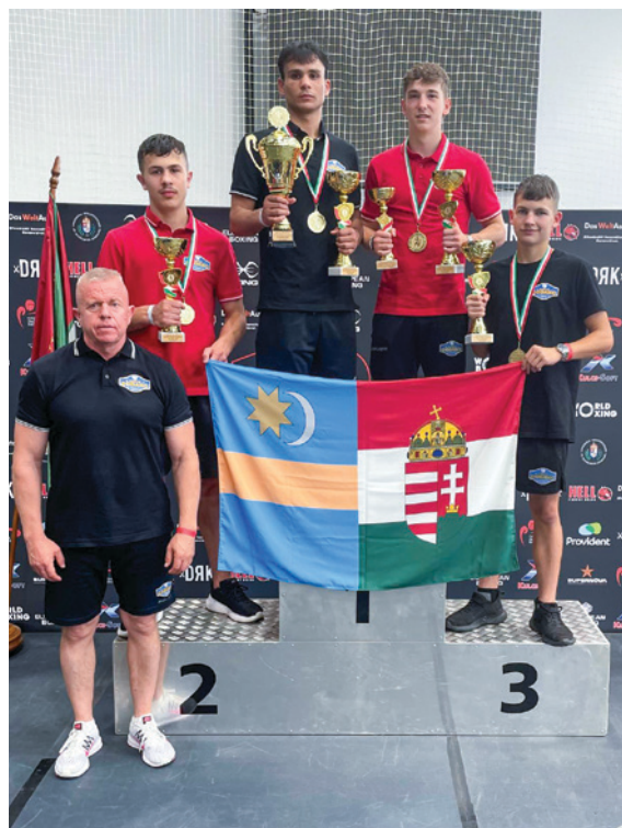
Az Erdélyi Godako Ökölvívó Sportklub Egyesület Gyergyószentmiklóson a Magyar Ökölvívó Szakszövetség szakmai partnereként Erdély több városát lefedő regionális ökölvívó-utánpótlásnevelő hálózatot fog össze és irányít.