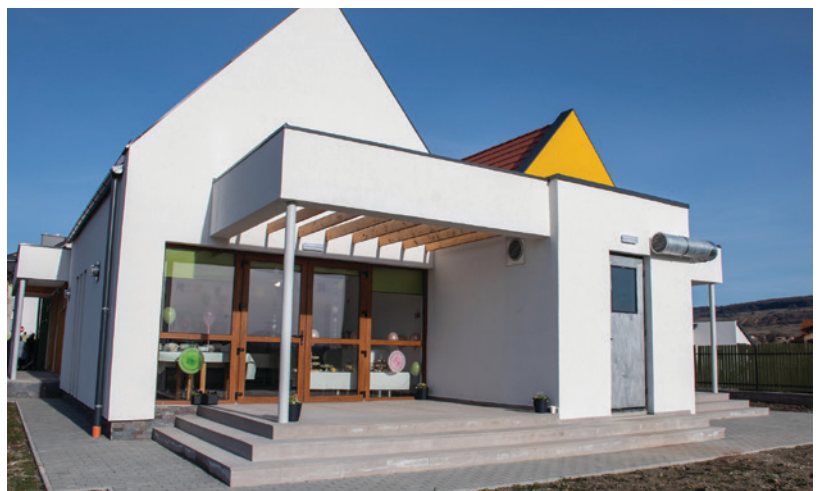
Ficánka Napköziotthon cseréhati tagintézményének építése, Székelyudvarhely (Romániai Magyar Pedagógusok Szövetsége)