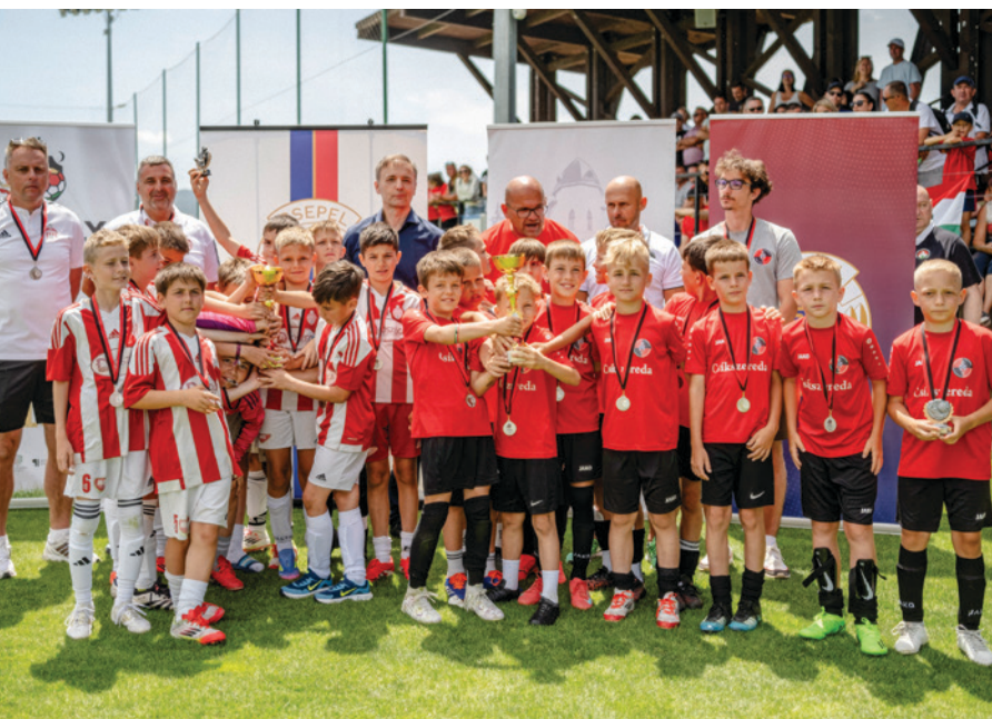
A Futball Klub Csíkszereda és a Seps OSK az erdélyi labdarúgás utánpótlását biztosító akadémiai rendszer, amelynek fejlesztése és magas szintű szakmai működtetése nemzetpolitikai érdek.

2011 óta több mint 90 erdélyi sportszervezetet, intézményt támogatunk.