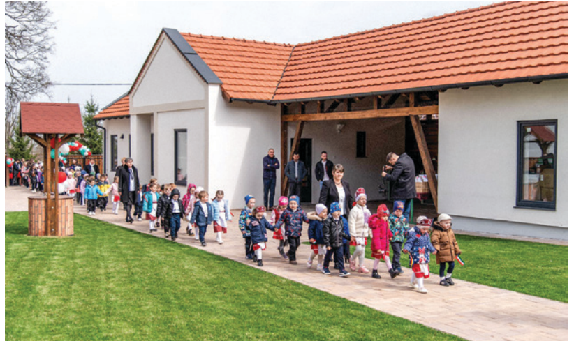
Érszalacsi Római Katolikus Plébánia új óvodájának építése, Érszalacs (Nagyváradai Katolikus Püspökség)

Az erdélyi beruházások megvalósítása során a magyar kormány partnerei a történelmi magyar egyházak és a Romániai Magyar Pedagógusok Szövetsége voltak.