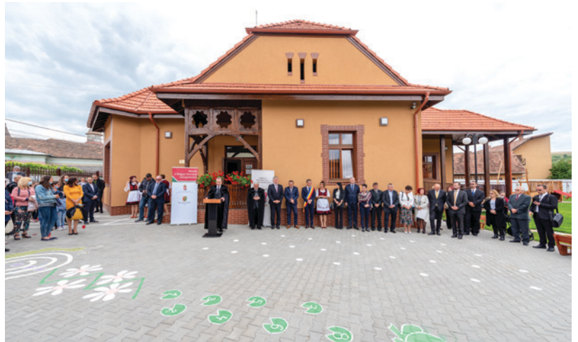
Új református óvoda és bölcsőde építése, Marosludas (Erdélyi Református Egyházkerület)